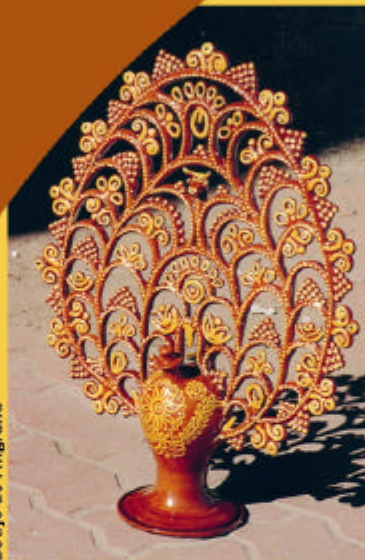
Botijo de Filigrana