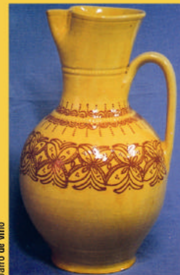
Jarro de Vino